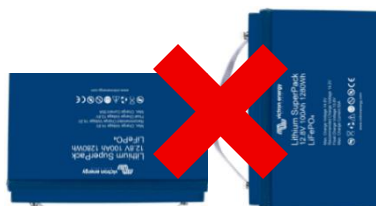
Todas las baterías (4)