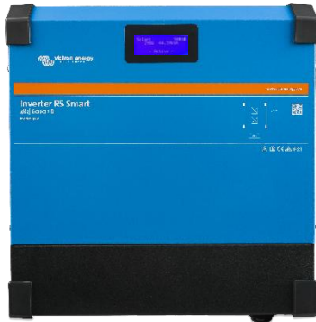
Inversor RS Smart 48/6000