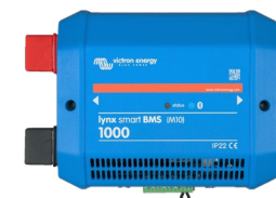
Lynx Smart BMS 1000 A