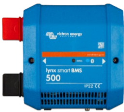
Lynx Smart BMS 500 A